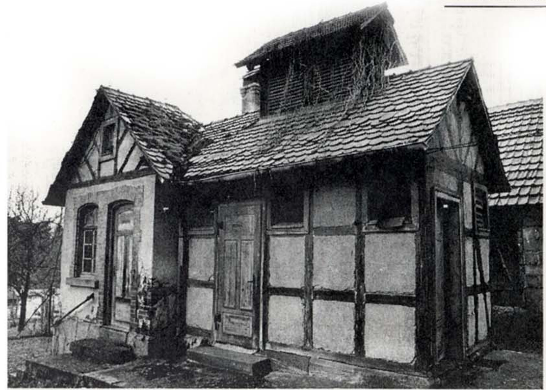
Unter dichten Schlingpflanzen versteckt überdauerte das Klohäuschen der Schule in Frommenhausen die Jahre. Im vorderen Teil sind die Toiletten, hinten die Waschküche und der Kohlenkeller.

Nach oben sorgt ein offener Dachstuhl für die Entlüftung, von außen am Gatteraufbau zu erkennen. Hinter dem Toiletentrakt ist quer zur Firstrichtung die Waschküche angebaut. Der Kessel für die große Wäsche ist nicht mehr da, auch nicht mehr Waschbecken und was sonst noch dem täglichen Frischmachen gefrommt haben könnte. Ein Heizöltank steht in dem Raum. Er diente der Ratsherrenwärme, nachdem die Schule 1971 geschlossen